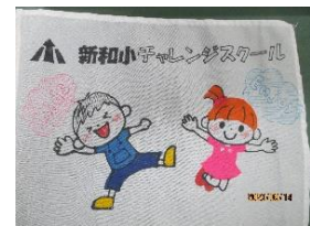
【チャレンジスクールの旗】

前回それぞれのチームが名前を決めました。チーム名をイメージして描いた絵をもとに、旗が完成しました。どのチームもできあがりに満足してくれたようでした。