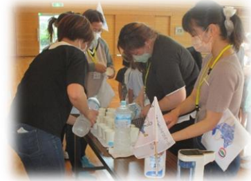
【冷たい水をいただきました。】

でした。大きな3密（密集・密接・密着）を避け、ボランティアさんたちから途中で冷たい水をもらい、熱中症にも注意しながら楽しくゲームを行いました。