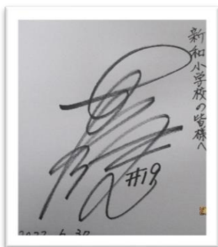
英田選手のサイン