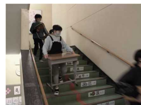
新学期の準備をする 新6年生

4月は出会いの季節です。新しい教室、新しい担任、新しい教科書。子どもたちの瞳の輝きを見ると、新年度を迎え気持ちを新たにし、やる気に満ちていることが伝わってきます。この気持ちは、教職員も同じです。受け持つ子どもたちのことを考えながら「どんな活動を取り入れようか」と考え、新年度の準備をしてきました。子どもたちの「やる気」がそのまま成長につながるよう、教職員一同、一生懸命取り組んでまいります。