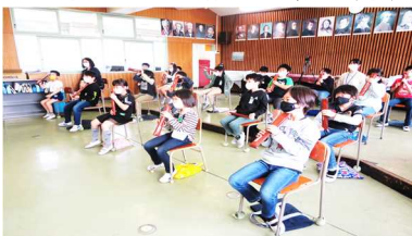
<ケースに入れたまま練習しました>